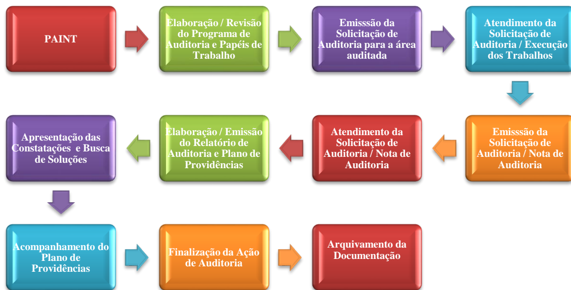
Figura 5 – Rotina de trabalho da UAUDI

Assim, a UAUDI definiu sua rotina de acordo com o fluxograma a seguir: