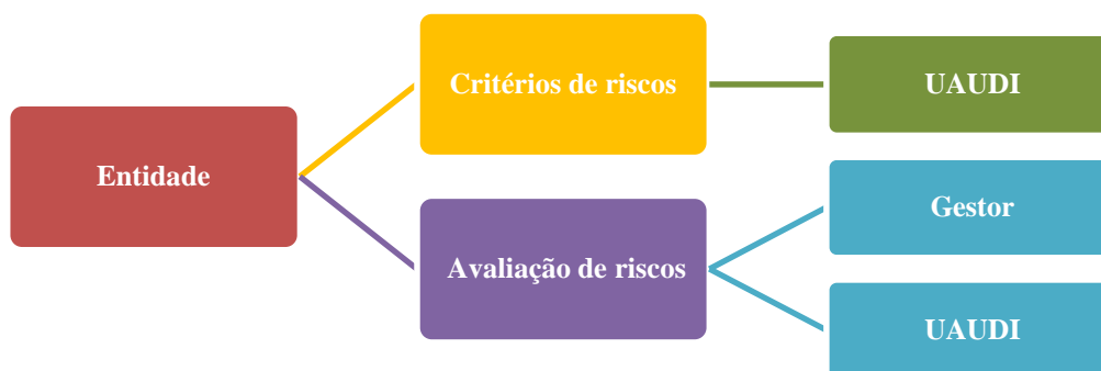
Figura 1 – Atuação da UAUDI na Implantação da ABR